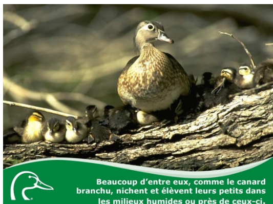
Beaucoup d'entre eux, comme le canard branchu, nichent et élèvent leurs petits dans les milieux humides ou près de ceux-ci.

📖 Visitez la section Détectives des canards sur le site education.canards.ca pour obtenir plus de renseignements sur la sarcelle d'hiver.