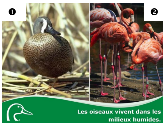
Les oiseaux vivent dans les milieux humides.