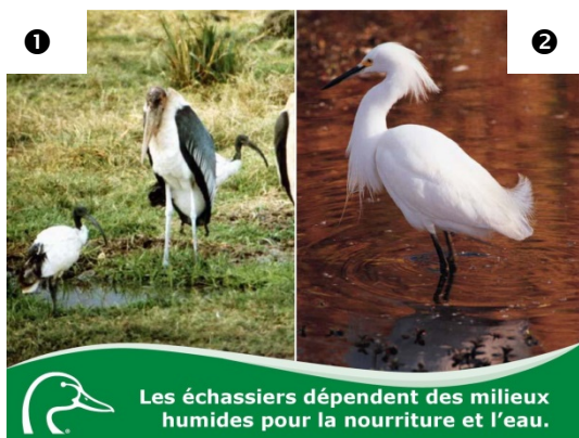
Les échassiers dépendent des milieux humides pour la nourriture et l'eau.

📖 Pour obtenir plus de renseignements sur le canard branchu et les efforts de conservation de CIC, notamment le programme de nichoirs, visitez notre site Web.