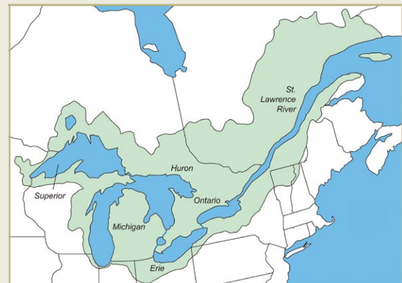
Ci-dessus : Le région Saint-Laurent-Grands Lacs est l'un des plus grands bassins versants du monde.

Les phragmites envahissants menacent les milieux humides sains. Quelles sont les solutions possibles pour lutter contre cette plante envahissante? Dans le cadre de cette étude de cas, vous découvrirez les solutions contribuant à faire revivre la biodiversité dans un milieu humide envahi par les phragmites.