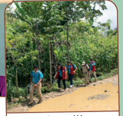
Certains villages du Guatemala