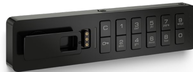
Standard Horizontal Knauf links