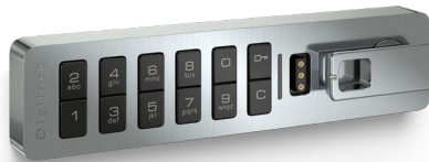
Standard Horizontal Knauf rechts